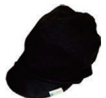
やわらかキャスケット