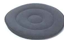
回転するざぶとん

車いすでの外出に便利なグッズや、疲れた時に座れるリュックをご紹介します。 どうぞ3階の福祉用具展示場にお越しください。