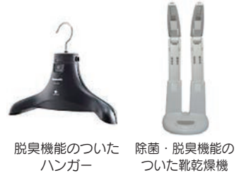
脱臭機能のついたハンガー 除菌・脱臭機能のついた靴乾燥機

6月は、「雨の日を快適に過ごせるお 役立ちグッズ」をテーマに雨の多い季 節に役立つ用具を紹介します。脱臭機 能のついたハンガーや電動で開閉す る傘、除菌・脱臭機能のついた靴の乾 燥機を展示します。どうぞ3階の福祉 用具展示場にお越しください。