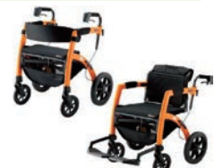
一台二役で使える歩行車