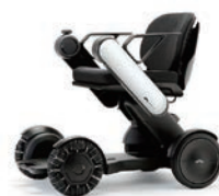
スタイリッシュで機能的な電動車いす

4月のテーマは、「外出お助けグッズ」です。スタイリッシュで機能的な電動車いすや、立ち上がりや座り直しの介助をアシストしてくれるジーンズ、介助用車いすとしても使える一台二役の歩行車など、安心して外出するためのお助けグッズをご紹介します。どうぞ3階の福祉用具展示場にお越しください。