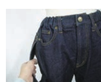
介助をアシストしてくれるジーンズ