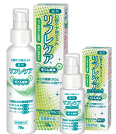
口腔ケア用ジェル