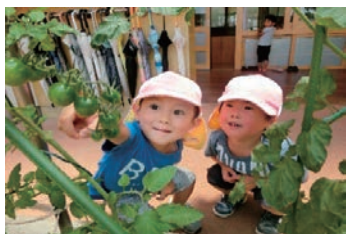
前年度 西日本新聞社賞の受賞作品

問合せ 福岡市保育連盟(福岡市保育協会内) 電話 713-0541 FAX 713-0674